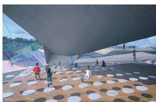
Auditorio del Campus

Este campus virtual en 3D al que el alumno tendrá acceso durante todo el curso, las 24 horas del día, facilita el correcto aprendizaje del contenido del curso, la participación en foros de debate, vídeos interactivos, ejercicios prácticos, contenido interactivo multimedia, autoevaluaciones, archivos de descarga, enlaces webs, acceso al contenido bibliográfico, permite la interrelación con otros alumnos y con el profesorado, y muchas más posibilidades.