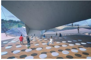
Auditorio del Campus